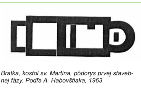
Bratka, kostol sv. Martina, pôdorys prvej stavebnej fázy. Podľa A. Habovštiaka, 1963

Levice, o ktorých časť autorov tvrdí, že ide o stredovekú dedinu Staré Levice (O Leva, Óléva), ktorá sa pod týmto názvom spomína až v r. 1388. Staré Levice zanikli počas tureckých vojen v roku 1614 dnes sú vlastne na južnom okraji intravilánu nášho mesta. Našťastie, k Bratke existuje aj ďalšia, iba o dva roky mladšia listina (1158), ktorá sa zachovala v origináli. Táto listina, aj keď ich výslovné nemenuje, prináša dôležité informácie aj k Leviciam. Namiesto Levíc sa tu uvádza dedina „Zamto“ (dnes by sa volala Santov), kde boli tiež usadení hostia.. Obidve listiny sú uložené v Arcidiecéznom archíve v Ostrihame.