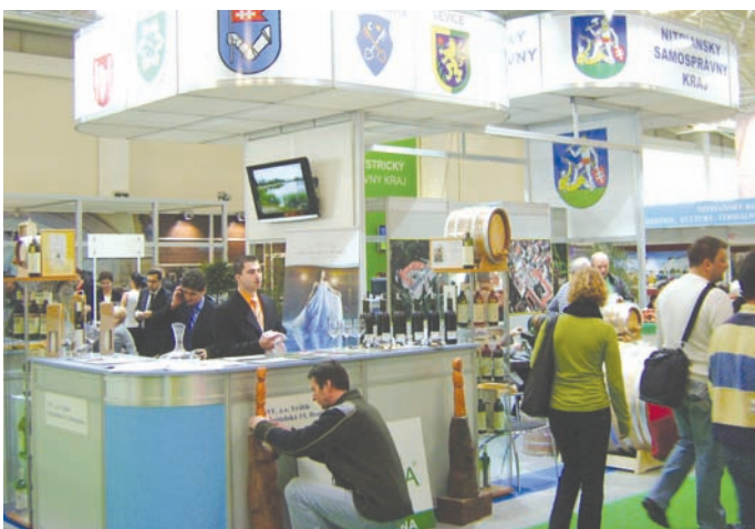
Mesto Levica sa v dňoch 22. a 23.1. 2009 prezentovalo na veľtrhu cestovného ruchu ITF SlovakiaTour v Bratislave