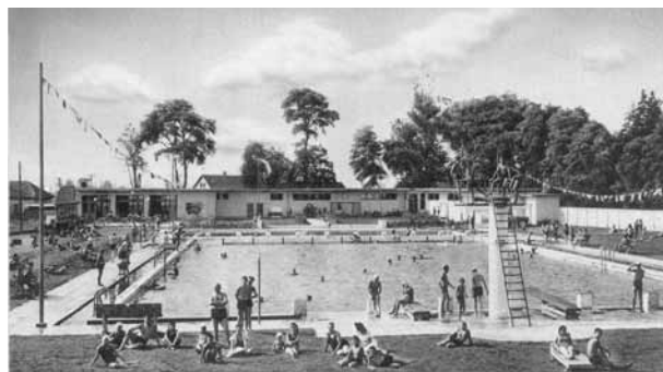
Obrázok č. 2 - Mestské kúpalisko okolo roku 1940

Pozemky s Člnkovacím jazierkom podobne ako aj iné pozemky rodiny Schoellerovcov mesto postupne odkúpilo a postavilo na nich murované kúpalisko s dvoma bazénmi, so skokanským mostíkom, šatňami a reštauráciou Halászcsárda. Stavba sa začala v čase existencie prvej Československej republiky, dokončená bola v roku 1942. Bazény napúšťali vodou z Percu, ktorá pretekala cez štrkové filtre, odtok viedol jarkom ústiacim do Podlužianky v blízkosti Grégerovej krčmy (dnes pri križovatke ulíc M. R. Štefánika a Turecký rad).