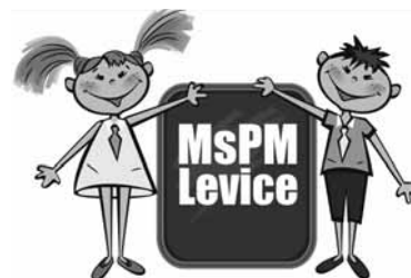
Mestský parlament mládeže v Leviciach

meste Belgicka, v Bruseli. Po náročnej ceste hneď na druhý deň navštívili historické námestie a ochutnali výbornú čokoládu, keďže Belgicko je známe svojimi čoko obchodmi. „Belgiciania sú veľmi pohostinní ľudia, ktorí nám