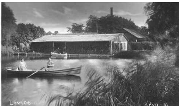
Obrázok č. 1 - Jazierko pri Perci r. 1927

Na mieste mestskej plavárne sa kedysi nachádzalo umelé Člnkovacie jazierko (Csónakázó tó) prepojené s Percem, ktoré v lete slúžilo na člnkovanie a v zime na korčuľovanie a hokejové zápasy. Perc ponúkal miesta na kúpanie, rybačku, posedenia a prechádzky končiace sa až pri Sótyho mlyne. Každá zátočina mala vlastný názov (Veľké C, Malé C a iné) a každú vyhľadávala iná skupina obyvateľstva (študenti, vojaci, rodiny s deťmi, reholné sestry, atď.). Z technického hľadiska sa v Leviciach nachádza rarita, tzv. zhybka (ľudovo podtok), kde Perc podteká Podlužianku pri bývalej reštaurácii Halászcsárda. Toto mies-